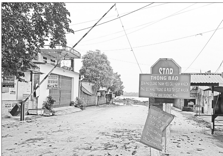
Bến phà Quang Thanh tại xã Thanh Cường đã dừng hoạt động từ nhiều ngày nay

T HỰC hiện Chỉ thị 16 của Thủ tướng Chính phủ, TP Hải