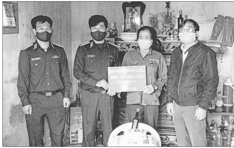
Ban Chỉ huy quân sự huyện Bình Giang tặng quà cho gia đình có hoàn cảnh khó khăn

Ngày 13.4, Ban Chỉ huy quân sự huyện Bình Giang trao tặng 10 suất quà (mỗi suất trị giá khoảng 500.000 đồng) cho hộ nghèo ở 3 xã Cổ Bi, Thái Học, Bình Minh.