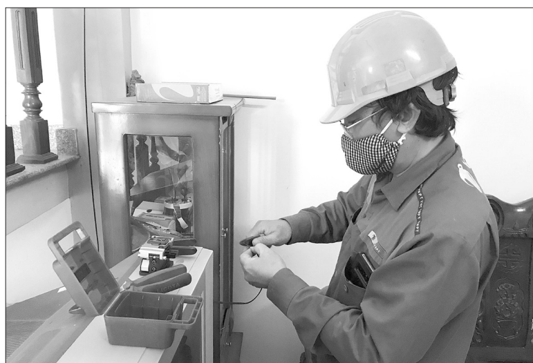
Nhu cầu người sử dụng internet tăng cao dẫn đến tình trạng mạng bị quá tải

Bên cạnh đó, tuyến cáp quang biển AAG thuộc nhánh Việt Nam kết nối đi Hồng Kông xảy ra sự cố vào ngày 2.4 khiến việc truy cập các trang quốc tế bị chậm, đặc biệt là vào buổi tối. Trong khi đó, hiện có nhiều cơ quan, đơn vị,